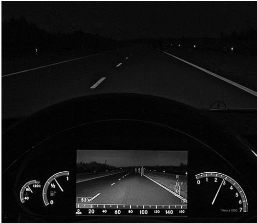
de display met infrarood nachtzicht

Met dimlicht (gewoon licht) kun je in het donker 70 meter vooruit zien. De auto van Bernard heeft infrarood nachtzicht. Met infrarood nachtzicht kun je op een display 140 meter vooruit zien.